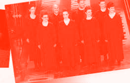
Anne Domini Gospel Singers ITALIA